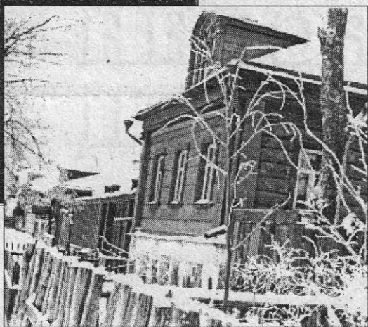
Дом на ул. Комсомольской, в котором жила семья Пришвиных.

В журналах «Красная новь», «Новый мир», «Огонек», «Охотник» и в «Охотничьей газете» один за другим появляются его охотничьи рассказы, а в 1929 году в «Новом мире» начала печататься повесть «Журавлиная родина». Под таким названием стал известен читателю край знаменитых дубненских болот, тогда еще богатых дичью, константиновская долина, Заболотское озеро, изобилующее утками и хранившее еще