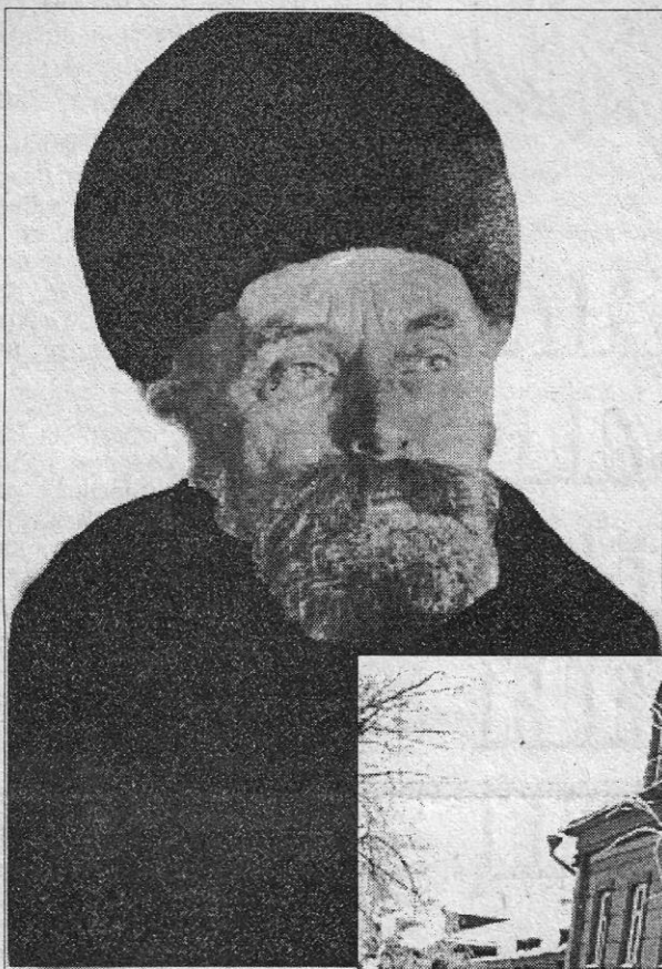
30-е годы, Загорск. М. М. Пришвин.

Приложение к газете «Вперед», 2001 год. № 1 (61)