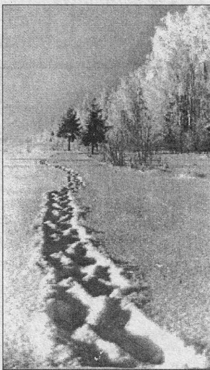
Фотография М. Пришвина.

Мы быстро нашли с ним общий язык и общих знакомых-охотни-